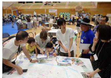
《ようこそ守谷へ2018の様子》